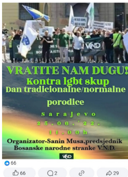
Slika br. 3: Najava kontra LGBT skupa 2022. na FB