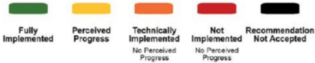
Slika 1: Sistem „semafora“ u poluciklusnom izvještavanju

Poluciklusno izvještavanje je prilika za dodatnu suradnju institucija BiH i OCD-a na provedbi preporuka UPP-a. Pripremom zajedničkog poluciklusnog izvještaja institucija BiH i OCD-a može se dodatno izgraditi povjerenje između svih dionika UPP-a.