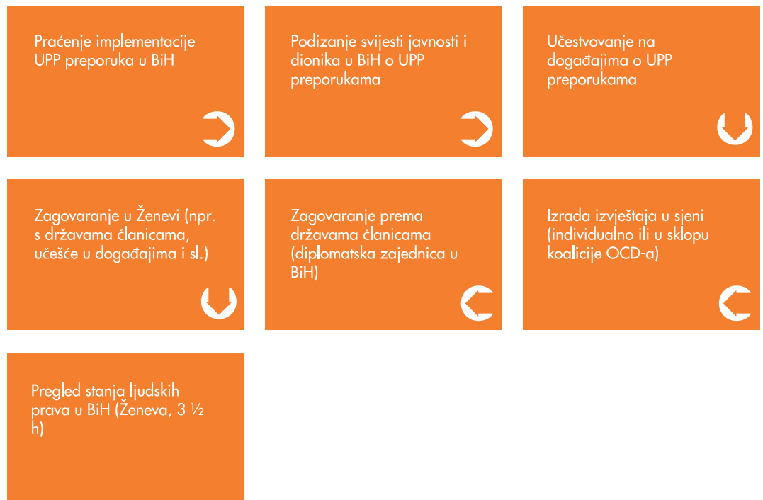
Shema 2: Učestvovanje civilnog društva u BiH u UPP ciklusu

Godinu dana prije održavanja pregleda u Ženevi, svi dionici usmjeravaju svoje aktivnosti ka procesima izvještavanja o UPP preporukama i stanju ljudskih prava u državi, zagovaranju i pripremi izvještaja u sjeni.