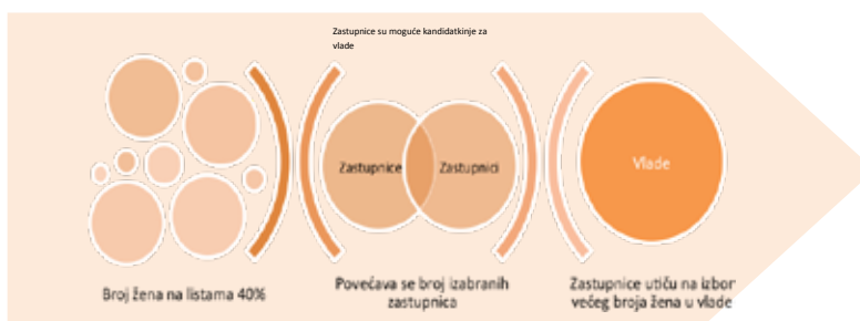
Figura br. 1: Prikaz trenutnog pristupa u BiH

Na potrebi ulaganja u unapređenje mogućnosti žena za izgradnju političke karijere, baziran je pristup afirmativnih mjera 11 u pravnom sistemu Bosne i Hercegovine. Njime se teži povećati ponuda stručnih i politički iskusnih žena, koje kroz kvote za liste kandidata i kroz iskustvo, koje steknu u zakonodavnim tijelima, trebaju povećati svoje šanse da će biti imenovane u saziv izvršne vlasti.