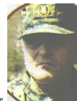
JELEČ: Sve ispitati

Generalmajor Ante Jeleč, načelnik Zajedničkog štaba OSBiH, ostao je zatečen saznanjem o skandalu. On kaže da s takvim aktivnostima nije upoznat, ali da će tražiti detaljnu istragu.